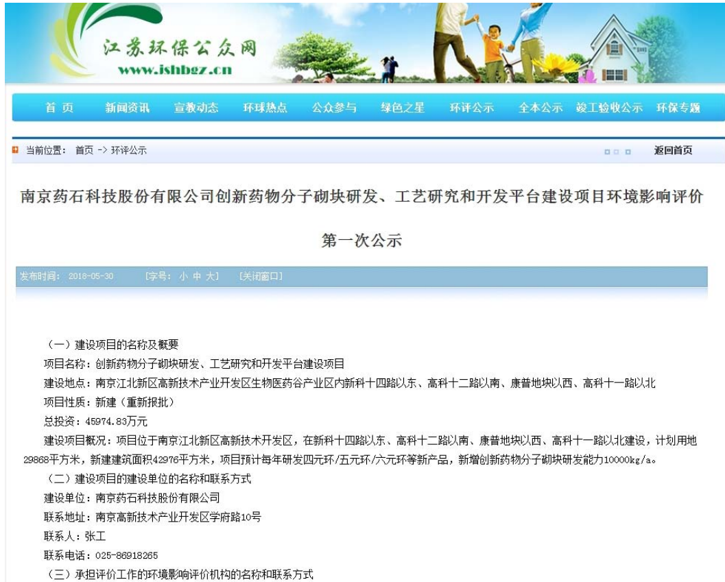
图 2.2-1 第一次公示网页截图