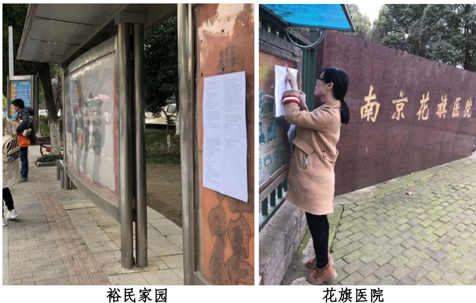
图 3.2-5 现场张贴公告照片